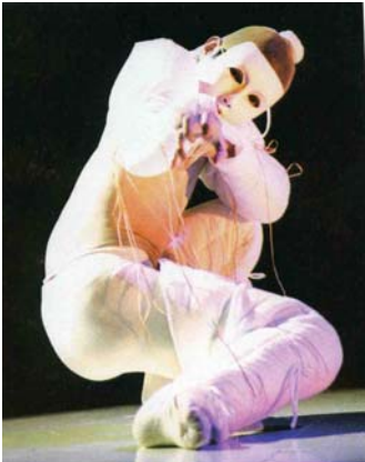
Théâtre Patravadi In Danser N°231