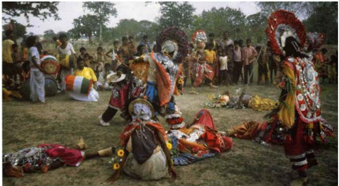
Défaite des génies maléfiques. Photo Marie Noëlle Robert In « Danses de la terre » Françoise Gründ. Editions La Martinière